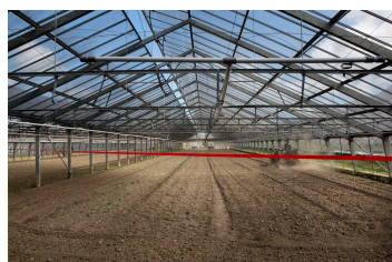
La Ligne, Genève 2017.